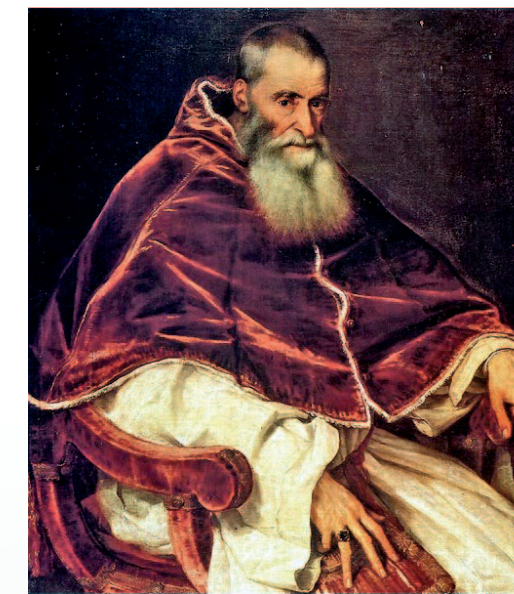
PAOLO III (ALESSANDRO FARNESE) CONVOCÒ IL CONCILIO DI TRENTO NEL 1545