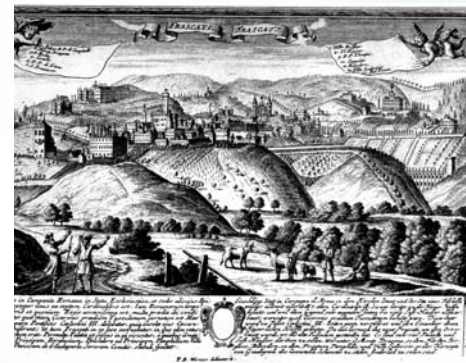
FRASCATI, INCISIONE DI F.B. WERNER (pubblicata da J.C. Leopold) c.1750.