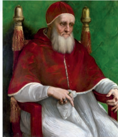
RAFFAELLO: PAPA GIULIO II (1503-1513) (Giuliano della Rovere 1443-1513) Nel 1483, quando era abate commendatario, fece costruire le mura fortificate intorno all'abbazia di Grottaferrata