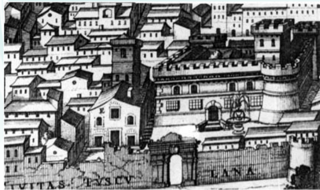
S. MARIA IN VIVARIO E LA ROCCA NELLA SECONDA METÀ DEL '600. Particolare da un'incisione di Atanasio Kircher (1671).