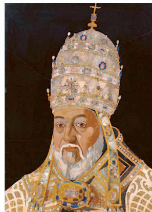
CLEMENTE VIII (ALDOBRANDINI) mosaico secentesco